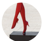
Terrassa planta 1 (C) Noia evadint-se , 1967