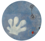
Sala 2 Pintura (El guant blanc) , 1925