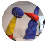
Sala 12 Parella d'enamorats dels jocs de flors d'ametller. Maqueta , 1975