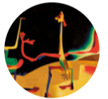
Sala 4 Home i dona davant d'un munt d'excrements , 1935