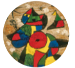
Sala 11 Tapís de la Fundació , 1979