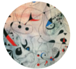
Sala 4 L'estel matinal , 1940